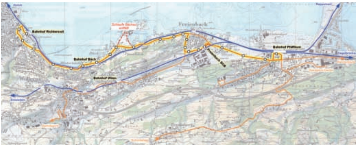
Abb. 1: Linienführung Bächer-Bus

Zur Gewährleistung eines stabilen Fahrplans zwischen Bäch und Pfäffikon im 30-Minuten-Takt ist auf die Erschliessung der Bächau zu verzichten; der Bus verkehrt direkt via Seestrasse. Die Haltestelle «Usserbäch» wird an die Seestrasse verlegt, sodass die Bächau weiterhin im Einzugsgebiet der Buslinie liegt.