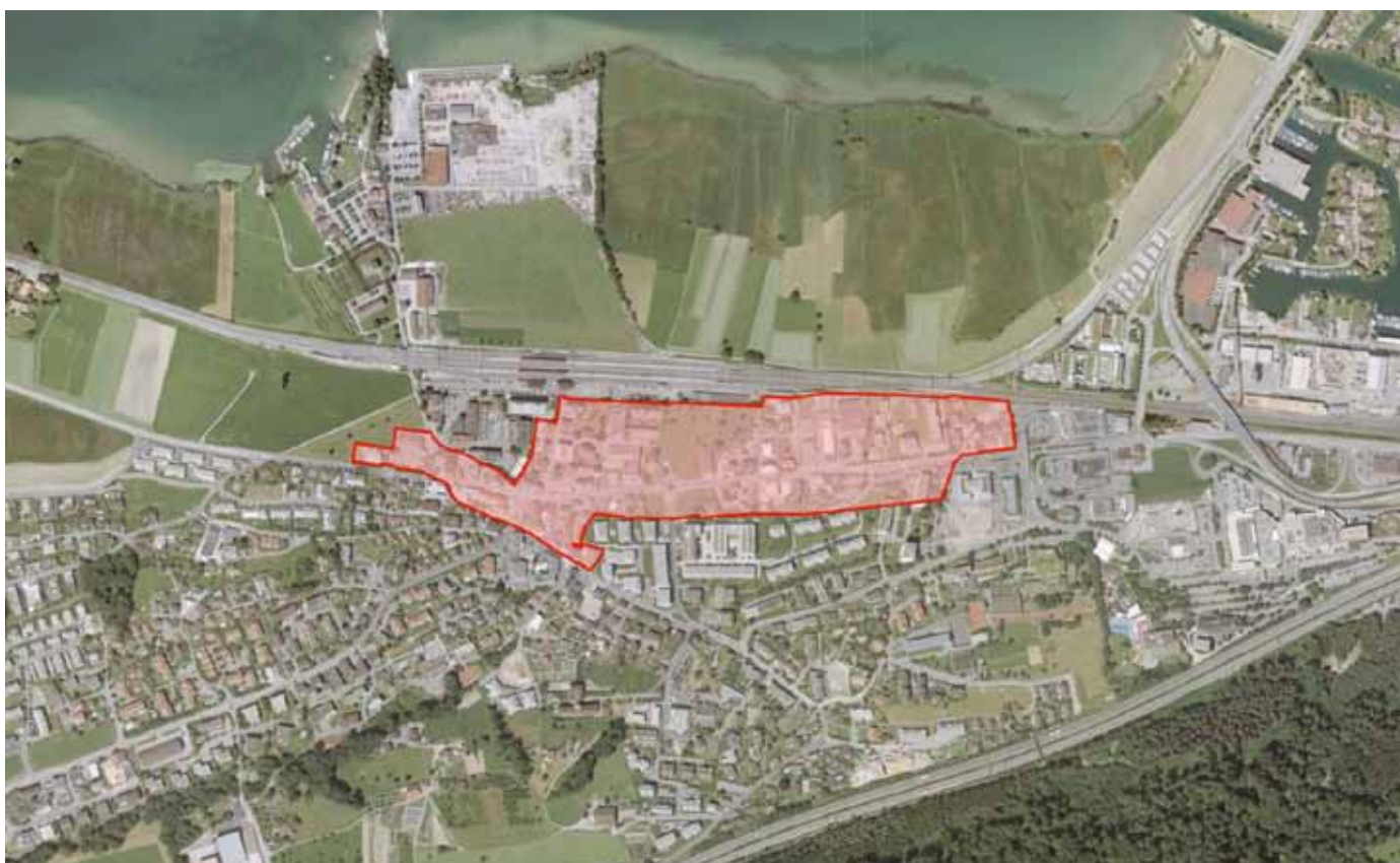
Abb. 1: Lage des Gebietes Teilzonenplanung Zentrum Pfäffikon (rot markierte Fläche).

Die Teilzonenplanung Zentrum Pfäffikon umfasst den für die weitere Entwicklung des Dorfs wichtigen Bereich beidseits der Churerstrasse und erstreckt sich vom Schulhaus Brüel im Westen bis zur Brücke Gwattstrasse im Osten. Die Gesamtfläche beträgt rund 145'000 m 2 . Der Bahnhof Pfäffikon als regional bedeutender Knotenpunkt des öffentlichen Verkehrs grenzt im Norden direkt an das Gebiet.